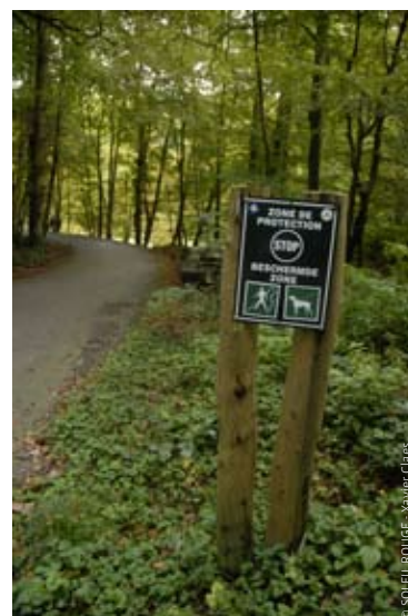
En forêt, respectez toujours la signalisation

Dans toutes ces zones, les promeneurs doivent impérativement rester sur les chemins et les chiens doivent être tenus en laisse. (Ordonnance du 30 mars 1995).